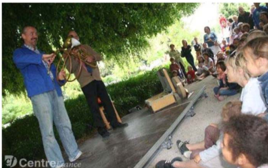
Dimanche dernier, la caustique « Leçon de musique » a charmé le jeune public.

Dernier rappel des comédiens avant que les rideaux de l'été théâtral au parc Pasteur ne se referment !