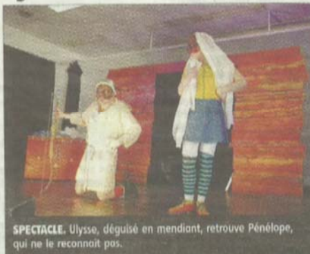
SPECTACLE. Ulysse, déguisé en mendiant, retrouve Pénélope, qui ne le reconnaît pas.

Version burlesque de la mythologie, où les deux comédiens sont tour à tour les héros de l'aventure. Christophe Thébault, Ulysse aux multiples fa-