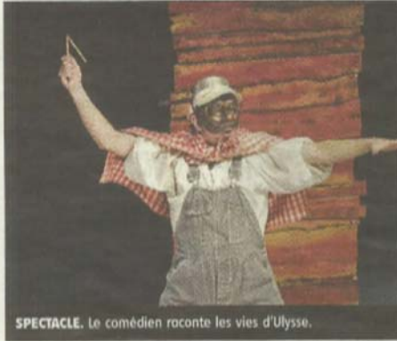
SPECTACLE. Le comédien raconte les vies d'Ulysse.

Jeudi et vendredi, des élèves assisteront au spectacle « Les vies d'Ulysse », d'après l'Odyssée d'Homère, à l'espace Loire. Dans le cadre de son action théâtre et école, la communauté de communes du Val d'Ardoux propose trois représentations aux écoliers.